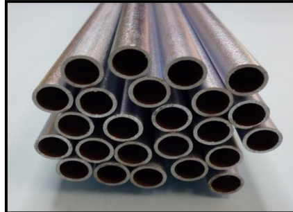
二重巻鋼管・一重巻鋼管 炭素鋼鋼管・配管用精密鋼管