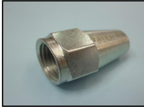
フレアナット C ニゲ付